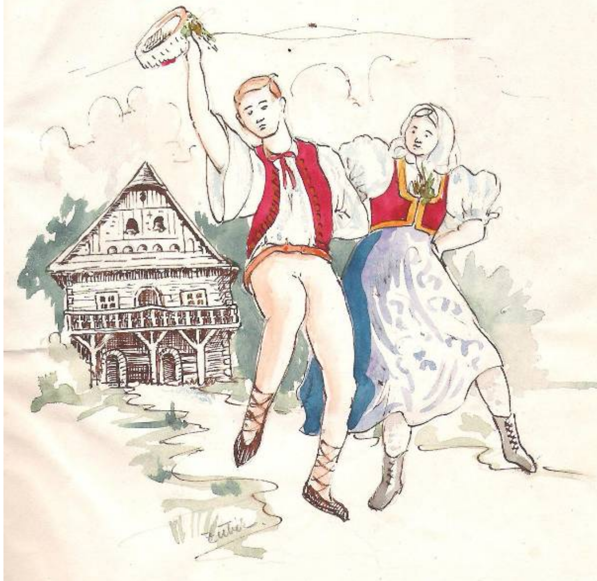
Úvodní stranu Kroniky při založení souboru namaloval J. Zúbek