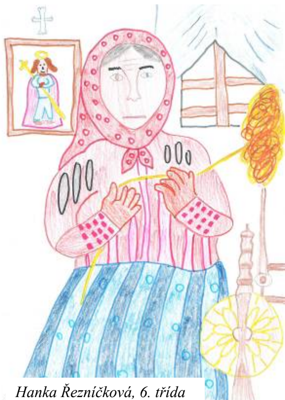
Hanka Řezníčková, 6. třída

Takové písničky se mi líbí, protože je většinou znají všichni lidé z vesnice. Často nejsou spisovné, text mají v překrásném valašském nářečí. Umí člověka pobavit, mnohokrát rozveselit, někdy i dojmout.