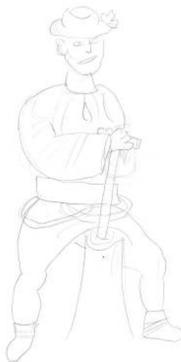
Štěpán Bařina, 8. třída