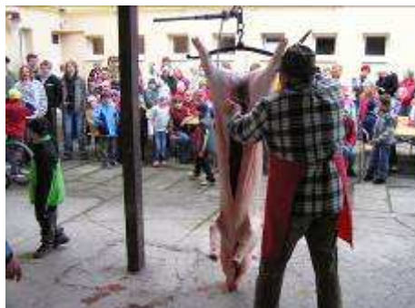
zabíjačka podle Josefa Lidy