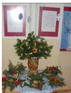
Vánoční galerie - výzdoba