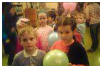
noc s Andersenem

Velkým zážitkem byla akce Noc s Andersenem, kdy šest žákyň 9. třídy ve spolupráci s uč. 1. tř. a knihovnicí paní