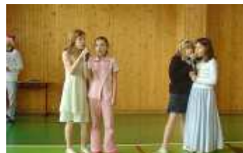
účast na X-faktoru