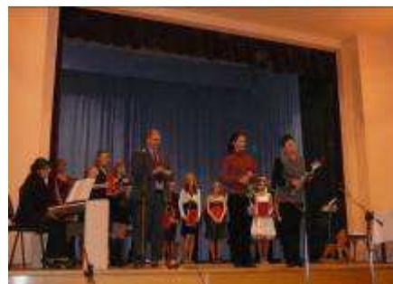
Vánoční galerie - vystoupení

Tolik exkurze do ekonomiky, která dnes hýbe světem.