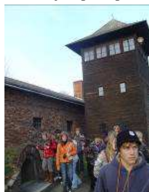
exkurze v Osvětimi

Úspěch na konci: 96% přijatých žáků deváté třídy na SŠ v prvním kole!