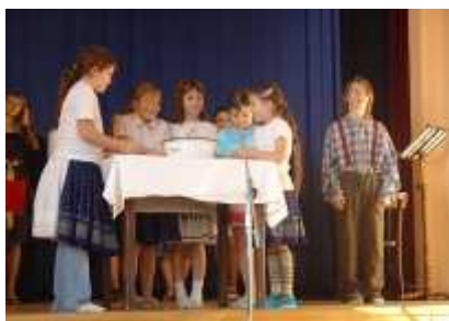
vystoupení na Vánoční galerii

kterého se žáci dozvěděli spoustu nových informací týkajících se vesmíru, sami si vyrobili makety planet a raketoplánů a vytvořili společně knihu, do které mohou dodnes kdykoliv nahlédnout. Na závěr tohoto projektu navštívili také Hvězdárnu ve Do Zámku Kinských se žáci přírodovědy, a to na program kde se dozvěděli zajímavé Beskydy. V rámci přírodovědy prohlédnout si Výzkumnou v Zubří.