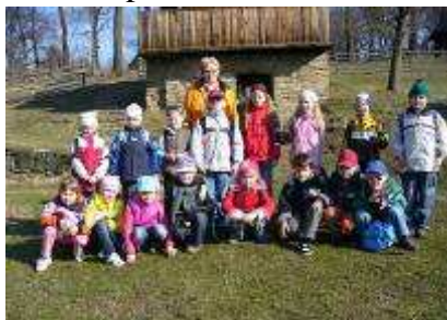
ve Valašském muzeu v přírodě

školákům líbilo vystoupení Valašky a zejména to, že si každý žák 9.tř. vzal patronát nad jedním z prvňáčků. Poté jsme se rozešli do tříd, kde se děti opět nestačily