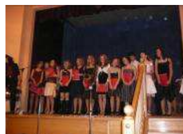
Vánoční galerie – vystoupení žáků 9. třídy

slovo má paní učitelka Neradová, ale na výzdobě galerie se podílí celá škola. Mně osobně se líbí Vánoční galerie, která se připravuje dlouho předem. Vše bývá trochu tajemné a v celé kráse se představí na počátku doby adventní. V den jejího otevření mají vystoupení devátáci, letos se zapojili i žáci z ostatních tříd. Ti, kdo se na výzdobě a přípravě nejvíce podílejí, bývají také odměněni. Po Vánocích (jako několikrát v roce) se výzdoba v galerii zase obmění.