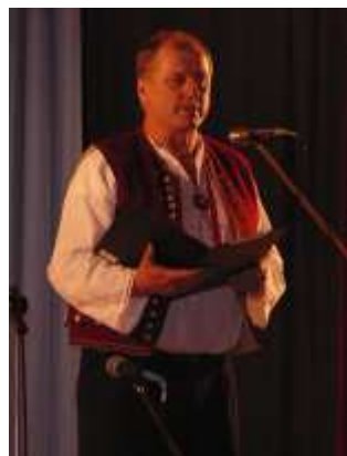
Valaška, oslav 55. výročí

Předkládáme toto vydání časopisu jako reference rodičům o práci žáků a školy v letošním školním roce včetně výhledu do budoucna. Zároveň jako „pozdání k prostřenému stolu“ pro ty, kteří získají důvěru k práci naší školy a rádi by své dítě posadili právě do našeho vláčku k cestě za poznáním .