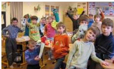
příprava na recitační pásmo

Nejprve jsme navštívili program Valašského muzea v Rožnově Jak se dřívě zpracovávalo dřevo. Podruhé jsme jeli na Hutisko-Solanec za malířem panem Majerem do jeho ateliéru. Celá třída pozorovala planety a Slunce na Hvězdárně ve Valašském Meziříčí. Hned o 4 dny později někteří z nás spolu s rodiči zhlédli pohádku Čarodějnice v Ostravském divadle. O drahokamech a špercích z nich nám ve škole povídal pan