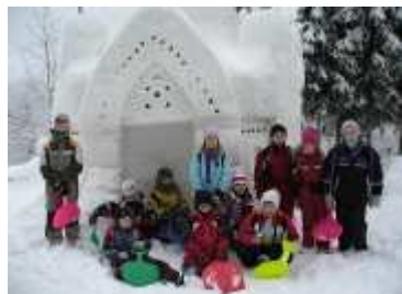
ledové sochy na Pustevnách

Také jsme sportovali: v naší krásné tělocvičně, na nově otevřeném hřišti, na kluzišti v Rožnově p. R. pod vedením zkušeného