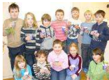
z projektu O nejzdravější svačinu

Pomalou se blíží konec školního roku a nás čeká ještě plavecký výcvik, školní výlet a určitě spousta dalších akcí.