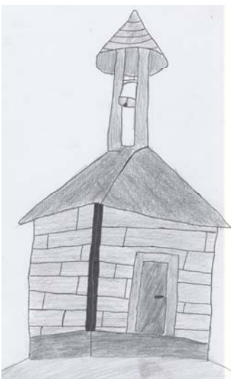
Roman Golda, 8. třída