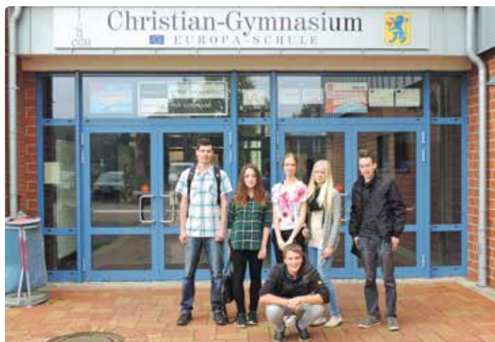
Studovali němčinu v němčině. | Foto: archiv studentů

„Skvěle, školský systém je propracovaný a praktický.“ (Katka) „Žáci se více aktivně zapojují do výuky než u nás ve škole.“ (Kamila) „Ve škole se více diskutuje o bíraných tématech.“ (Zdeněk, Adam) „Učitelé kladou větší důraz na