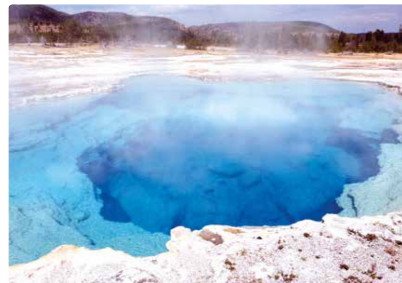
Geotermální jezero v Yellowstonu.

kteřé přichází v průměru každých 90 minut a trvá asi 2 minuty.