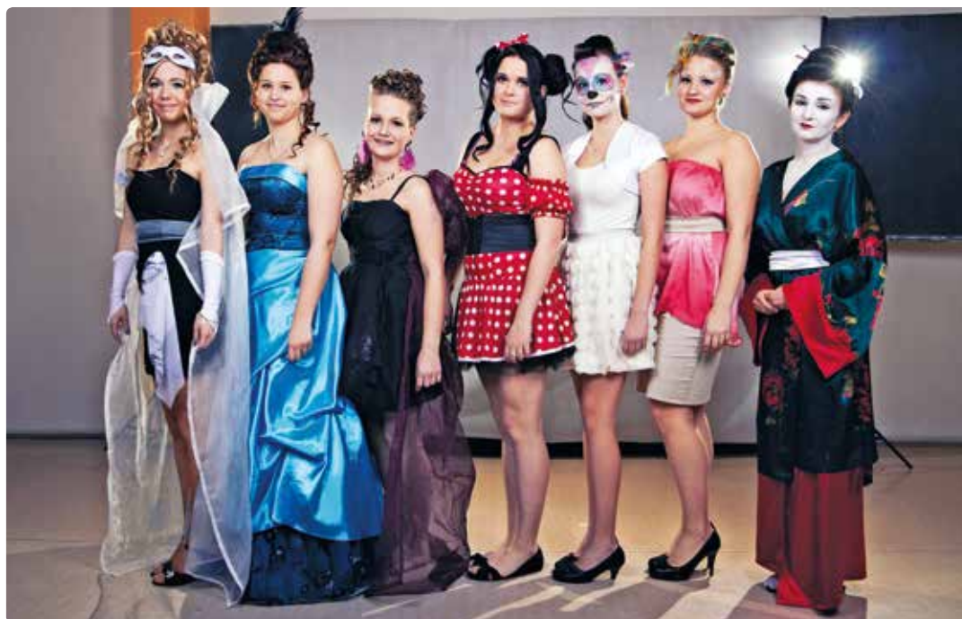
Karnevalová show byla zlatým hřebem večera.

Závěrečné defilé soutěže patřilo Karnevalové show, při níž jsme měli možnost zhlédnout krásné účesy a nádherné kostýmy, které žákyním pomohla zhotovit paní Eva Křenková. V závěrečné promenádě na nás dýchla karnevalová atmosféra. Diváci mohli zhlédnout např. Večernici, gejšu, čertici, zim-