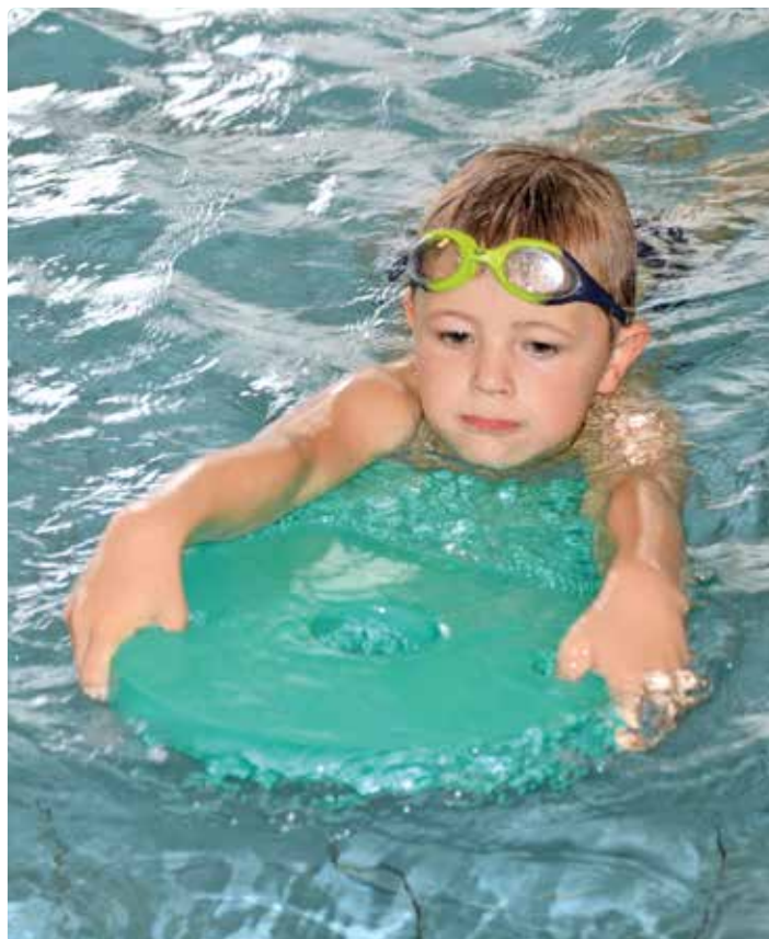
Školáci v bazénu ztrácí ostych z vody.

„Povinná výuka plavání probíhá ve třetích a čtvrtých třídách v rozsahu dvaceti hodin, přičemž všechny základní školy mají výuku plavá-