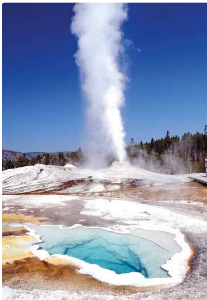
Old Faithfull Geysir - Yellowstone.

Co dělá z Yellowstonu tak barevné místo? Je to především geotermální aktivita a s tím spojené přírodní úkazy, které nemají jinde ve světě obdoby. Jsou tu k nalezení největší gejzíry světa, nachází se zde spousta vodopádů a velké množství horkých pramenů, horských jezer, kaňonů, erodovaných lávových proudů, četné fumaroly či bublající bahenní sopky.