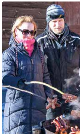
Opékané špekáčky turistům chutnaly.

v soukromých rukou. Do vrcholové knihy na Búřově jsme se proto podepisovali v náhradním objektu. Nazvali jsme ho studeným a nevlídným „kozím chlívkem“. Není divu, že každý z něj raději rychle zamířil k hasičům pod Ptáčnici na výbornou zelňačku, grilovanou krkovičku, teplý párek v rohlíku, horký svařák a jiné pochutiny. Členové SDH Valašská Bystrice i ten-