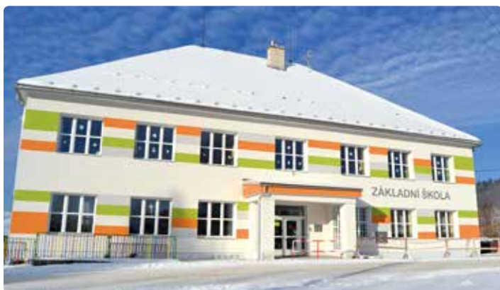
Novou barevnou fasádou se pyšní škola.

PROSTŘEDNÍ BEČVA • Více než deset kilometrů potrubí nové kanalizace přibýlo v posledních měsících v obci. Společný projekt Horní a Prostřední Bečvy za přibližně 90 milionů korun zlepšil životní prostředí v Kněhyních, Bacově, Adámkách a dolní části obce.