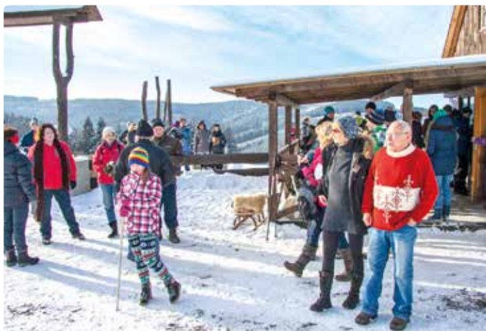
Výšlapu se zúčastnily všechny věkové generace turistů.

bílý sníh a teplota -7 °C. Kdo by neměl dobrou náladu! Akorát na Búřově nejednoho z nás zamrzelo, že chata, kterou v osmdesátých letech minulého století postavili členové Tělovýchovné jednoty Sokol Valašská Bystrice, byla pro účastníky výšlapu uzavřena. Dnes je už totiž