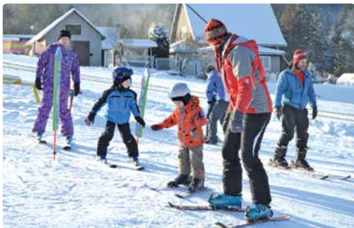
Malí lyžaři na svahu U Sachovy studánky.

HORNÍ BEČVA • Sportovně prožili o vánočních svátcích část svého volna někteří Hornobečvané. V hale základní školy se konal turnaj ve volejbale i ve stolním tenisu, na Nový rok si vyšlápli na Martiňák. Teploty pod nulou a sněžení umožnily rozjet vleky i proběhnout se na běžkách.