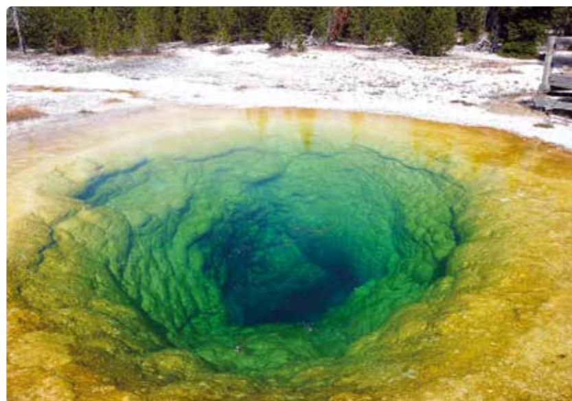
Geotermální jezero v Yellowstonu.